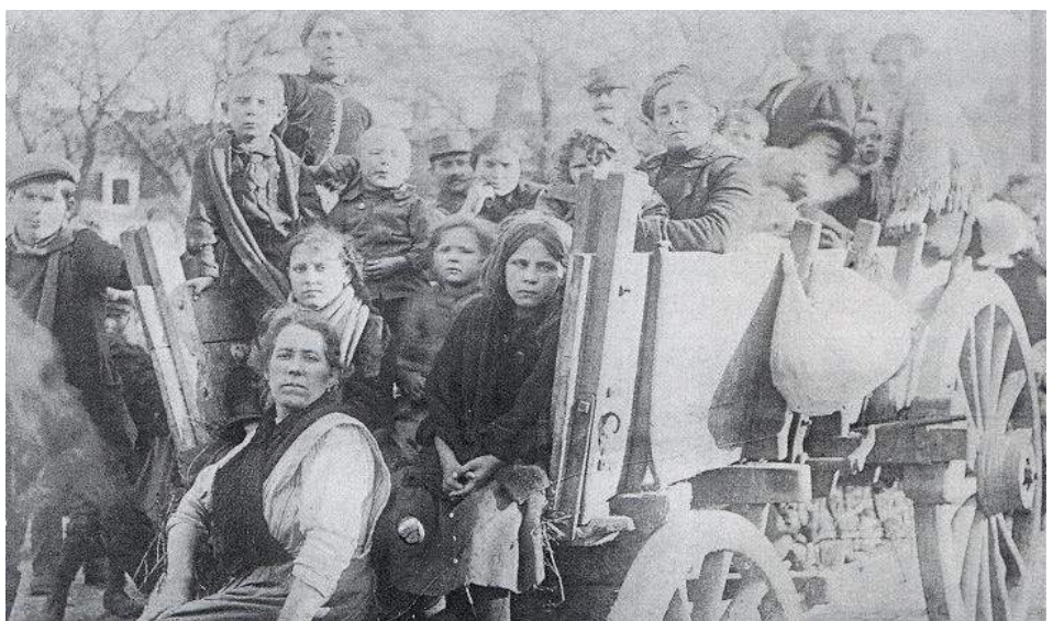
L'arrivée des bretons à Saint-Denis en 1906

C'est donc en cette fin d'année que notre association qui fonctionne