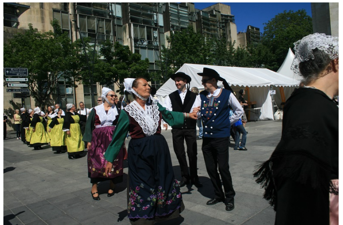
La fête bretonne, place Victor Hugo