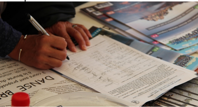
Signature de la pétition lors de la fête de Saint-Denis

L'amicale était présente aux vœux de la région, à la maison de la Bretagne, à Montparnasse. Nous faisons le choix de