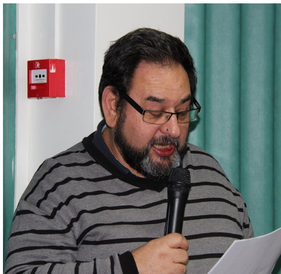
Guy lisant le rapport de la commission de vérification des comptes et appelant à voter le quitus aux trésoriers.

Les actions, crêpes, boutiques essentielle-