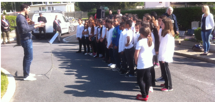
La journée de la Résistance, avec les enfants des écoles

Dans la vie citoyenne, l'amicale tient sa place. Nous étions présents en janvier devant la mairie, pour la défense de la liberté d'expression et contre le fanatisme, avec notre déclinaison en breton de « je suis Charlie ». Nous avons pris notre part dans la défense du Parc Georges Valbon, poumon vert du département et lieu de loisir des habitants, menacé de bétonnage. Présents aussi lors de la commémoration de la Résistance, émus d'entendre des enfants et des adolescents, avec leurs enseignants, faire perdurer la mémoire collective. En novembre l'amicale a publié un communiqué sur les attentats de Paris et de Saint Denis. Ce texte a été repris dans le JSD.