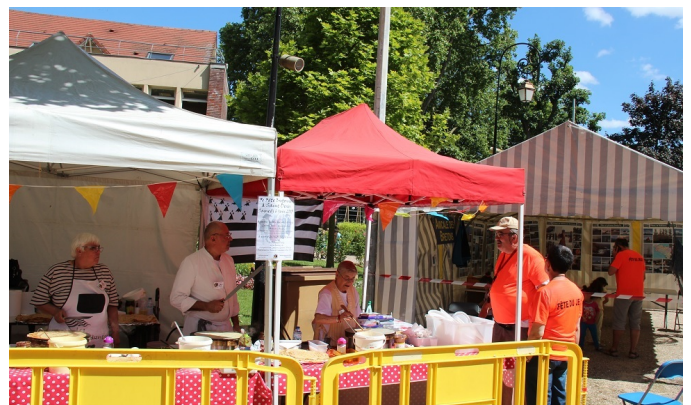
A la fête du jeu pour les enfants de Nanterre avec les amis de Saetrouville

C'était aussi le repas des bénévoles offert à tous ceux qui ont permis un tel bilan. Donc, si je quantifie tout cela, on trouve environ : 65 interventions soit plus d'une par semaine, 6000 crêpes et 2000 galettes, 40 bénévoles réguliers ou ponctuels. On trouve surtout des rencontres et des échanges, du stress et de la fatigue parfois, mais beaucoup de bonheur et d'amitié. Voilà à peu près, le résumé de l'activité en 2015. Une année riche, contrastée, qui s'est clôturée par une belle surprise : le dossier que Bretagne Magazine a consacré à notre amicale.