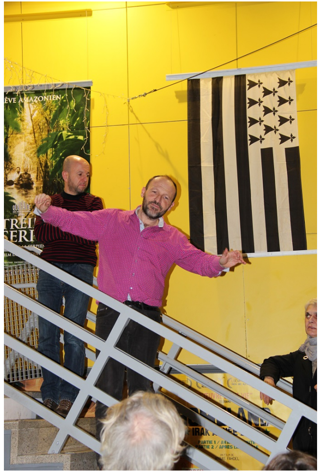
Tanguy mimant l'avion du Docteur Devilers (Alain Delon) poursuivant Hélène Masson (Annie Girardot).

autres). Si la séance est à 4,50 € pour tous, la séance est offerte par l'Amicale à ses adhérents.