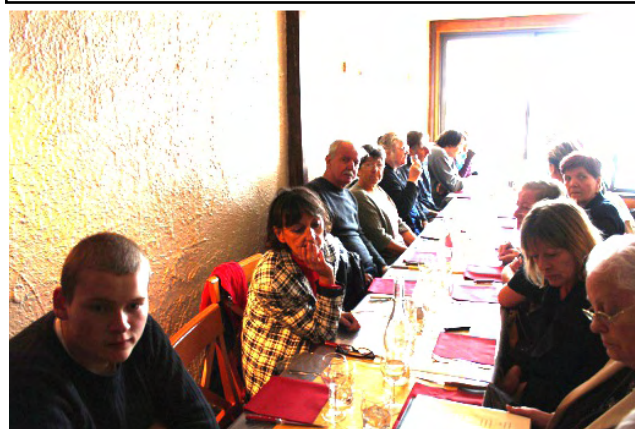
Un repas bien apprécié avant une promenade sur la plage