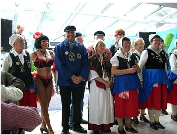
Une délégation de la Confrérie du Hareng