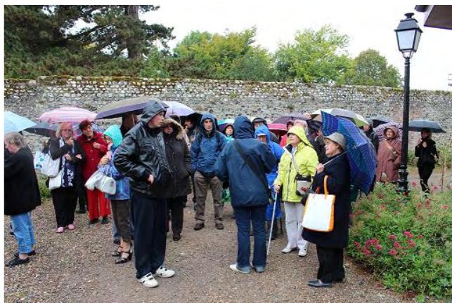
La journée a débuté avec de la pluie.

Ce fut une bien agréable journée et nous étions de retour à Saint-Denis à 20h 30.